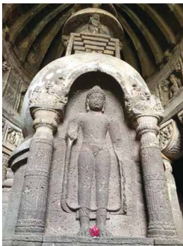
艾羅拉石窟內宏偉的佛教佛塔