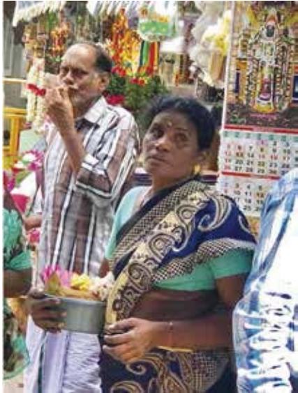
神廟外的小販販賣蓮花供人進廟膜拜