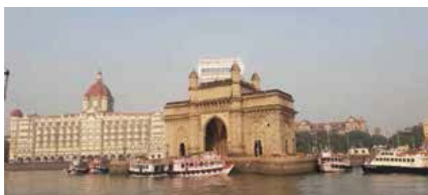
孟買熱鬧的碼頭旁有著兩座不平凡的建築，左為泰姬瑪哈五星飯店，右為當年英王喬治五世來印視察所建的印度門

這次在孟買還親眼見識到貧富的反差，印度第一首富有一幢造價450億台幣的住宅，27樓高，100多個房間，168個停車位，屋頂有三個停機坪。而在孟買另一隅有個千人曬衣場，一群人靠著洗衣維生，也許這也是他們一輩子的宿命。