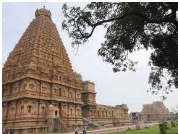
濕婆神廟是南印國王朝11世紀所建，宏偉壯觀，是印度教精雕細琢的建築

智慧之神象頭神在印度人心中代表著希望、財富、心想事成，其神廟不大但香火鼎盛，街上小販販賣蓮花供信徒拜拜祈福。