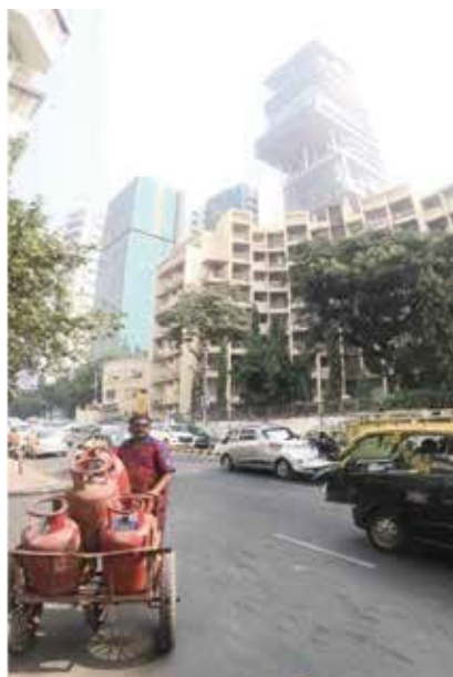
印度首富27層的住宅與經過運瓦斯的小販形成對比