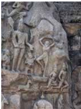
阿君那苦行僧的巨大石刻壁

神廟群最有意義的是海邊神廟，原有七座，其中六座已沈在海裏，只留一座仍聳立岸邊，曾在南亞海嘯中被摧毀，當地政府用原石材重新恢復。神廟群中最富傳奇色彩的當屬五戰車神廟，訴說五神的豐功偉績，雖是神話，但故事精采，聽起來倒也興趣盎然！