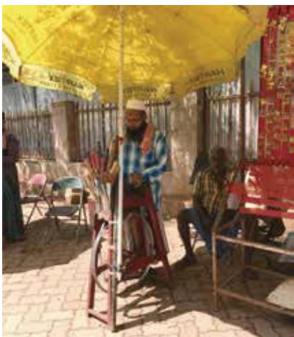
種姓制度底層人的生活困苦，在路邊販刀磨刀的小販

變現狀並處處制肘，少數人掌握了大部分的經濟，使富者愈富窮者愈窮。印度是金磚四國之一，有人說未來印度將取代大陸，但我看如今印度的貧窮與落後，可能50年後都未必趕得上大陸！