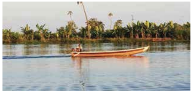
迴水域的居民都是利用小船出入，或購物或上學或做生意都少不了它

景雖美，但船屋條件仍差，蚊子、酷熱、冷氣被控制、熱水不足、停船點旁邊垃圾多…等等，這種船屋體驗一次就好。