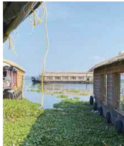
我們住的船屋通過水上人家前